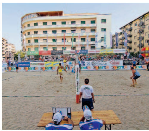
Il campo centrale