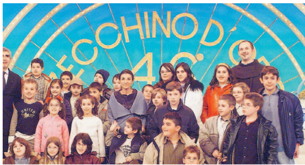
Una foto dello "Zecchino d'oro" dell'edizione dello scorso anno

Sono già cento, ma il numero è destinato a salire ancora, i bimbi iscritti alle selezioni per il 54. Zecchino d'oro, in programma la prossima settimana in Calabria con un fitto calendario: si parte mercoledì 29 nella nostra città (Studio Harmonic, in via Aldo Moro 32, dalle 11 alle 12 e dalle 17 alle 18), per proseguire poi nelle altre città calabresi.