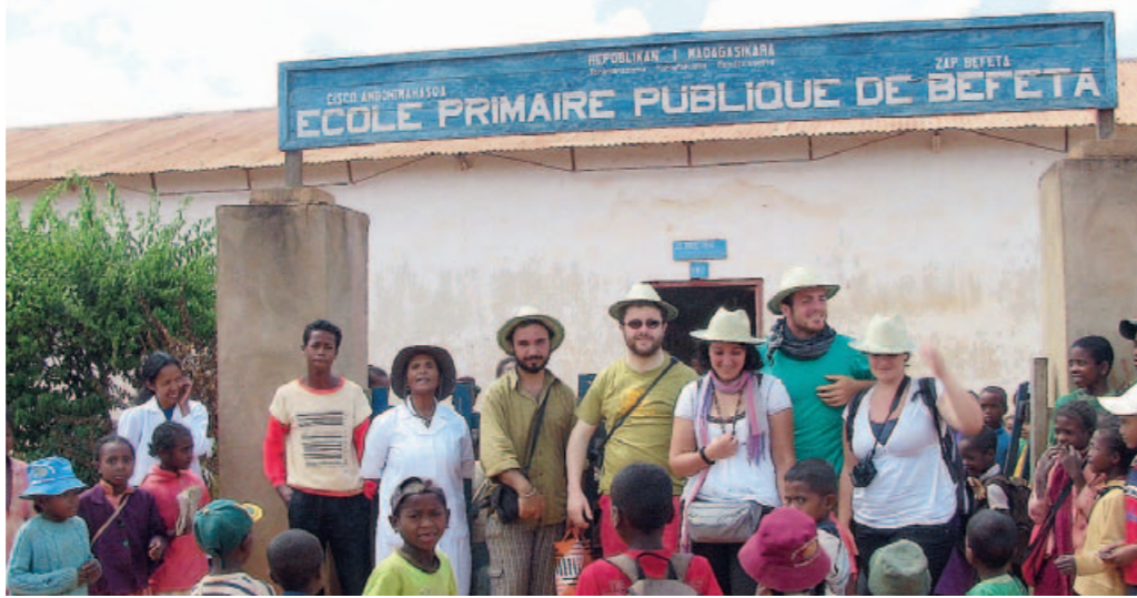
Una foto di gruppo degli "Ingegneri senza frontiere" in Madagascar

Isf è l'acronimo di Ingegneria senza frontiere. Già, senza frontiere. Tanto che uno dei progetti realizzati dai volontari che ne fanno parte si è concretizzato... in Madagascar. In occasione dell'anno europeo del volontariato, diverse sono le attività portate avanti dalle associazioni italiane. Una in particolare si pone degli obiettivi particolari: da qualche anno giovani ingegneri e studenti (dell'Unical) "reinventano" la tecnologia, intesa nel senso più ampio della parola, mentre la imparano a loro volta. Ciò che contraddistingue questi giovani volontari è l'approccio "esigenziale", -come amano definirlo loro, che associano a ciascun progetto. Prima, le persone e le loro esigenze. Poi le soluzioni progettuali e ingegneristiche. L'esperienza in campo ha insegnato ad Isf che è meglio portare una tecnologia semplice, ma gestibile dalla comunità. Ingegneria senza frontiere - in particolare le sedi di Roma, Firenze e Cosenza, sta